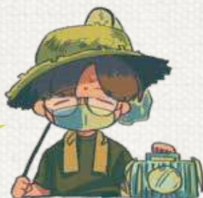
夏場セミに夢中になっていた コジマだより編集担当：菅原

いつもコジマだよりを読んでいただきまして誠にありがとうございます。夏のうちにクマゼミの捕獲に成功し、自粛しつつも夏を感じることができました。最近ではコロロギなど秋の虫が帰宅途中に聞こえ、小さい頃イナゴを捕っていたことを思い出します。